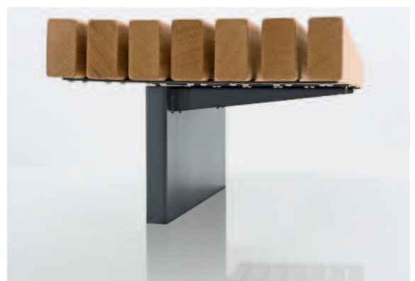
Die statisch wirksamen Träger bleiben unterwärtig verborgen.