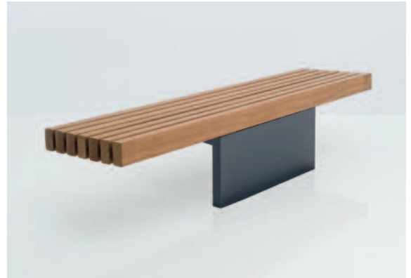
Der Stahlfuß ist mit 5,5 cm ebenso dick wie die Holzbohlen und schließt daher mit diesen rückwärtig bündig ab.