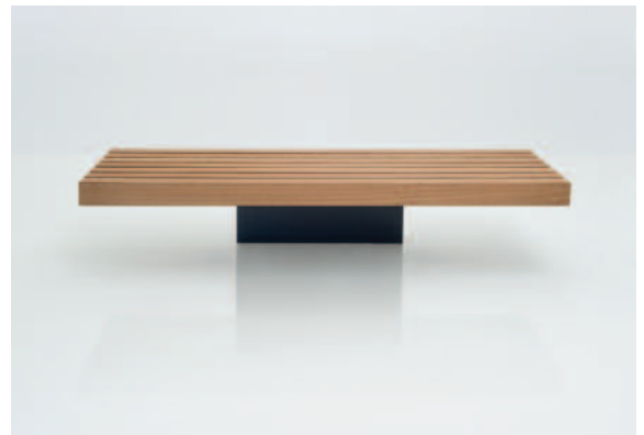
Die perfekte Symmetrie durch den mittigen Fuß.