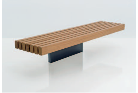
Hova Hockerbank mit FSC-zertifizierten Hartholzbohlen und Stahlfuß in DB 703 Eisenglimmer Anthrazit.